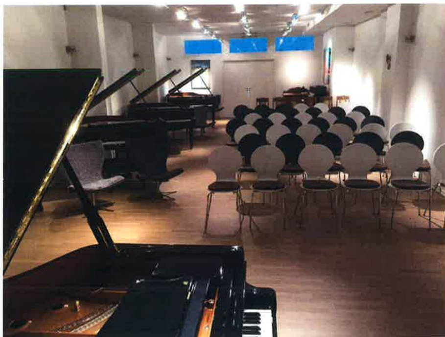
Creative pianos lokal på Bangatan